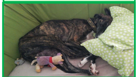
Casimero happily homed in Slovenia