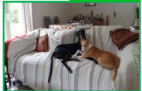
Orion (left) and Red together on their sofa in France